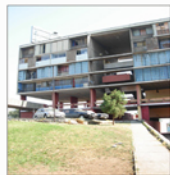
Grupo N°2 : Victor Arancibia Juan Gigoux

Conjunto residencial del periodo modernista en cual se encuentra con problemas de desuso y deterioro del espacio exterior.