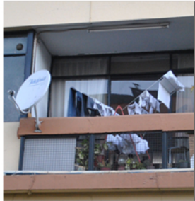
Balcon utilizado para colgar ropa, tambien se instalan antenas de television.

CON SOLO MIRAR EL BALCON, EL EXPECTADOR PUEDE SER CAPAZ DE CREARSE UNA IDEA DE LOS HABITANTES DEL DEPARTAMENTO, PODEMOS SACAR AL DESCUBIERTO POR EJEMPLO UN PERFIL PSICOLOGICO, PERSONALIDADES, GUSTOS, INTERESES. LOS EXPOSITORES QUE SON LOS HABITANTES DEL DEPARTAMENTO PODRIAN USAR LOS BALCONES COMO UNA FORMA DE MOSTRARLE A LA GENTE SUS COSAS.